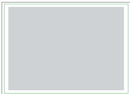
1:1 Vorlage auf Seite 2